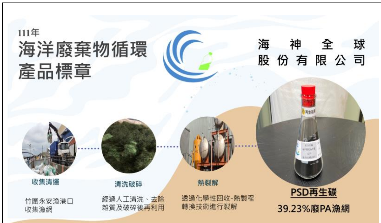
圖 4、111 年獲頒海洋廢棄物循環產品標章企業介紹-海神全球股份有限公司