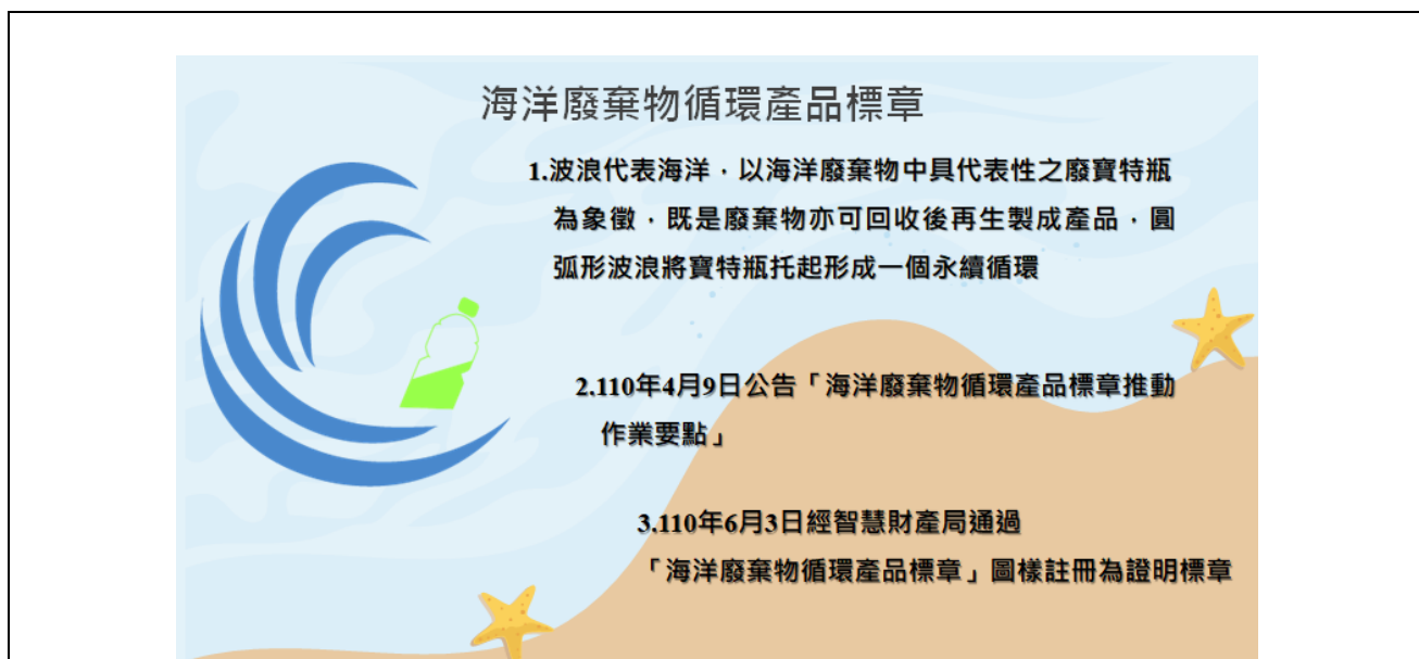
圖 1、海洋廢棄物循環產品標章介紹

海洋廢棄物循環產品標章以海洋廢棄物中具代表性之廢寶特瓶為象徵，既是廢棄物亦可回收後再生製成產品，圓弧形波浪將寶特瓶托起形成一個永續循環意涵。環保署 110 年 4 月 9 日公告「海洋廢棄物循環產品標章推動作業要點」作為企業申請及本署審核與管理之依據，同年 6 月 3 日通過海洋廢棄物循環產品標章經智慧財產局註冊。