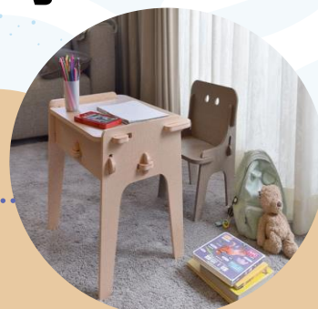
海廢轉生學習桌椅