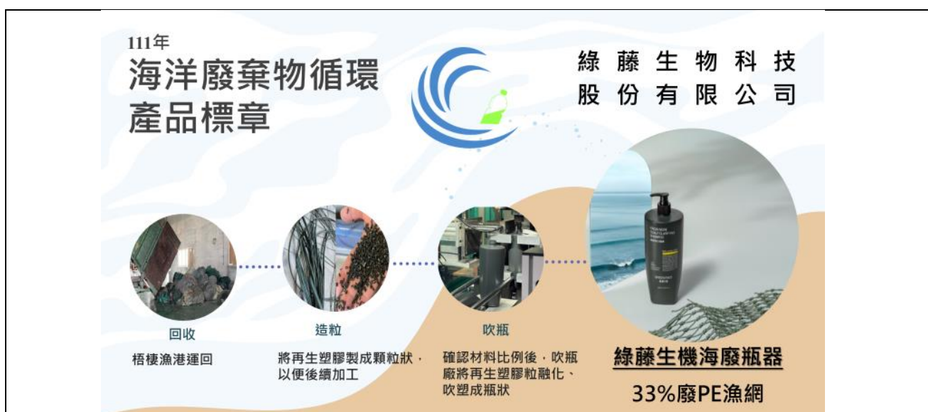
圖 2、111 年獲頒海洋廢棄物循環產品標章企業介紹-綠藤生物科技股份有限公司

海洋廢棄物循環產品標章以海洋廢棄物中具代表性之廢寶特瓶為象徵，既是廢棄物亦可回收後再生製成產品，圓弧形波浪將寶特瓶托起形成一個永續循環意涵。環保署 110 年 4 月 9 日公告「海洋廢棄物循環產品標章推動作業要點」作為企業申請及本署審核與管理之依據，同年 6 月 3 日通過海洋廢棄物循環產品標章經智慧財產局註冊。